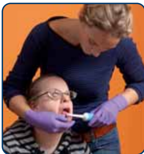
1. Ga achter uw kind of cliënt staan

Een juiste poetshouding is belangrijker dan u wellicht denkt. Te vaak staan ouders of begeleiders voor hun kind of cliënt. Maar dan heeft u weinig zicht in de mond, heeft u geen controle over uw kind of cliënt en staat u zelf in een kwetsbare positie. Laat uw kind of cliënt zitten en ga schuin achter hem staan. Fixeer het hoofd en kijk in de mond wat u doet. Druk de wang met uw vinger in de mond van uw kind of cliënt opzij en duw met uw duim de lip weg.